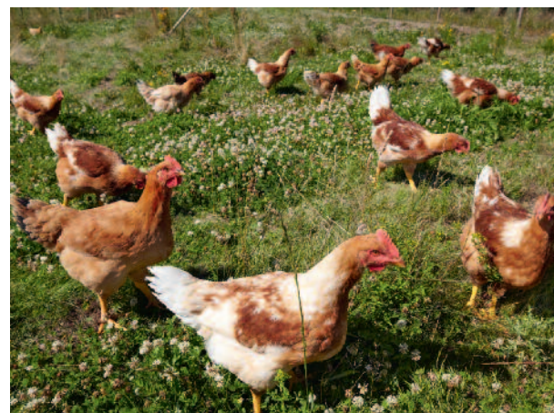
Kvalitet og balance er nøgleord for alle Vejros aktiviteter og er centrale for dyreopdrættet. Køer, grise og høns går frit på store marker, æder økologisk og er levende eksempler på fænomenet dyrevelfærd.

Kolumba™ klinken indendøre kom til verden, da en kunde for et par år siden bad om en klinker, der havde farve som caffè latte. Klinkerne – der går igen i mellembygningen, gårdbutik og i vinkælder – er lagt i et forbandt, der understreger husets opbygning.