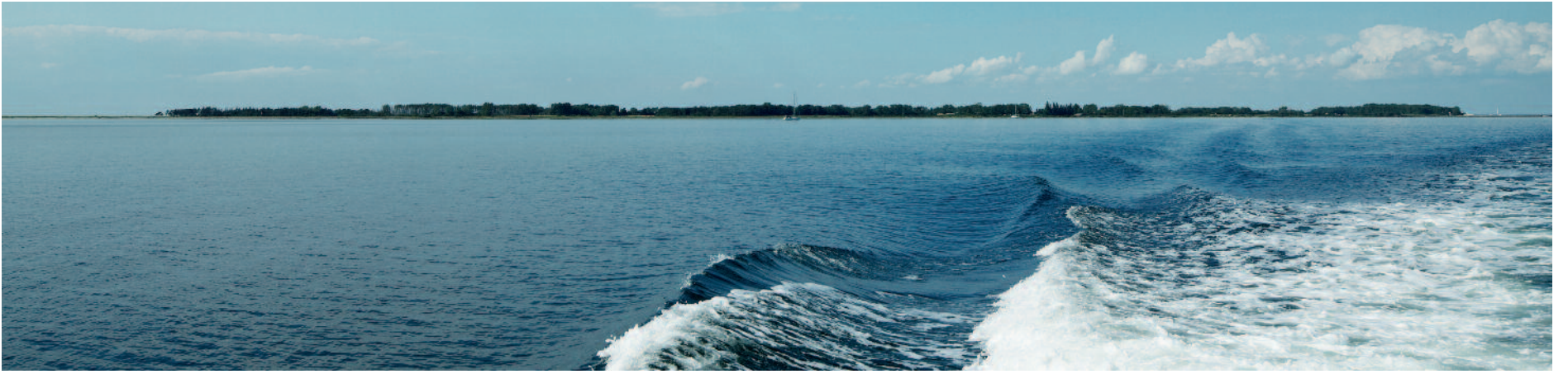
I hele sin udstrækning er Vejrhø 2,6 km lang, op til 700 meter bred og på i alt 155 ha, hvoraf de 100 ha drives som økologisk landbrug. Øen ejes af Saxo banks stifter, Kim Fournais.